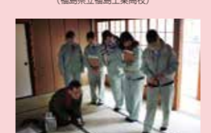
現地調査・診断実務 (福島県立津工業高校)