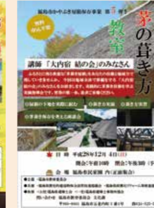
「茅の葺き方教室」チラシ