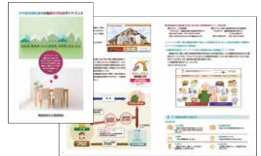
住宅確保要配慮者のための住宅相談ガイドブック