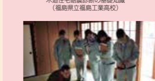
現地調査・診断実務 (福島県立津工業高校)