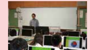
地震の発生のメカニズム (福島県立津工業高校)