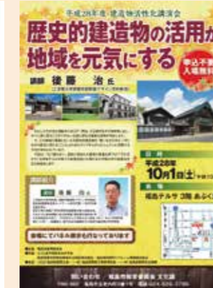
「歴史的建造物の活用が地域を元気にするセミナー」チラシ