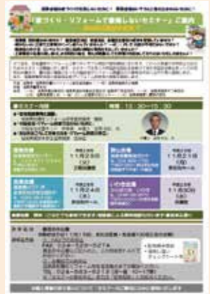
「家づくり・リフォームで後悔しないセミナー」チラシ

消費者及び事業者向けセミナーとして、平成28年11月から翌年1月にかけて県内5会場で「家づくり・リフォームで後悔しないセミナー」、平成28年12月6日に住宅リフォーム推進協議会との共催により郡山市ミュールがくと館にて「長寿命化リフォームセミナー」を開催。このほか、10月1日に福島市福島テルサにて「歴史的建造物の活用が地域を元気にするセミナー」12月4日には福島市あづま運動公園民家園にて「茅の葺き方教室」を開催しました。また、事業者への情報提供としては、建築士定期講習会及び省エネ講習会において住宅リフォーム推進協議会並びに地域協議会作成のパンフレット等を配布しました。