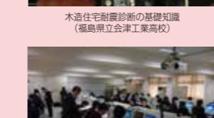
調査結果のデータPC入力実務 (福島県立津工業高校)