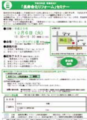
「長寿命化リフォームセミナー」チラシ