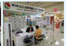
「不動産フェア・相談会」 (いわき市「鹿島ショッピングセンター」)