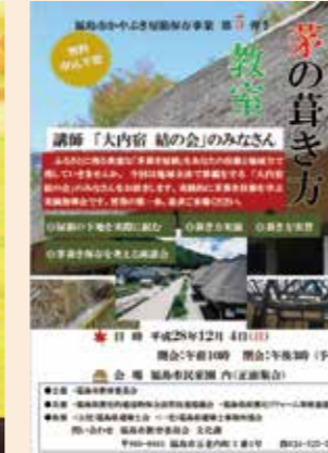
「茅の葺き方教室」チラシ