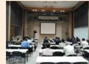
家づくり・リフォームで後悔しないセミナー