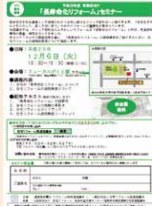
「長寿命化リフォームセミナー」チラシ