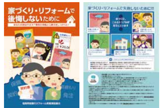
啓発パンフレット