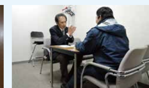
地域協議会相談対応状況