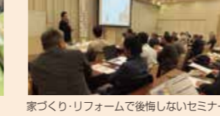
家づくり・リフォームで後悔しないセミナー