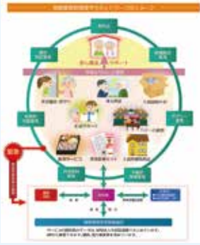
高齢者等地域見守りネットワークイメージ