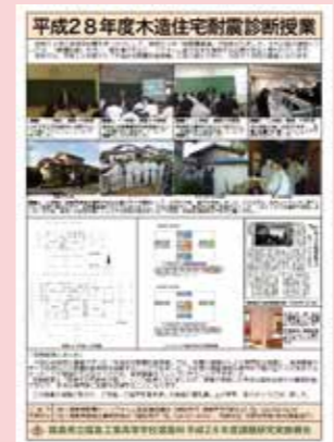
高校生が参加する地域防災授業チラシ