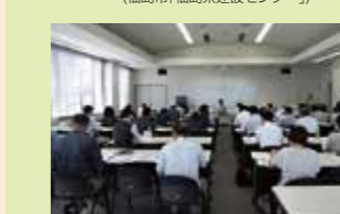
「住宅省エネルギー設計者講習会」 (白河市「サンフレッシュ白河」)