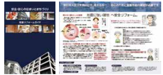
耐震リフォームガイド