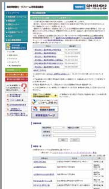
安心事業者登録データベース (2017年7月現在725件)