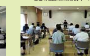
「住宅省エネルギー設計者講習会」 (南相馬市「道の駅南相馬」)