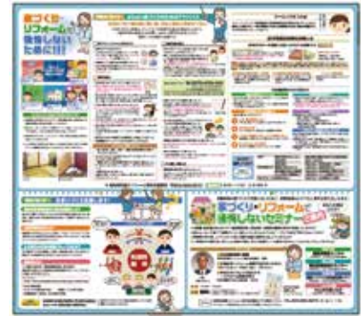
地域協議会新聞広告「後悔しない家づくり・リフォームのすすめ」