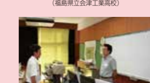
近年の地震災害と建築物耐震化の重要性 (福島県立津工業高校)