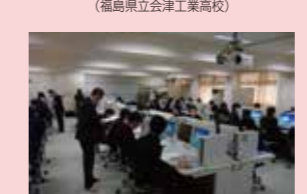
調査結果のデータPC入力実務 (福島県立津工業高校)