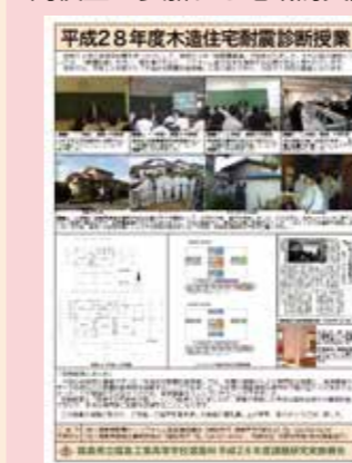
高校生が参加する地域防災授業チラシ