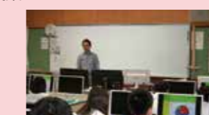
地震の発生のメカニズム (福島県立津工業高校)