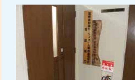
地域協議会事務所