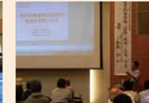
歴史的建造物の活用が地域を元気にするセミナー