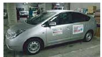
公用車用マグネットシート