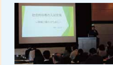
「ともに生きる ともに生きるセミナー」

東日本大震災被災者再建支援のため、居住支援協議会事務局に相談窓口を常設し、延べ316件の相談対応をしました。11月4日に「住宅・福祉連携セミナー ともに生きる」とも生きる」を開催し、高齢者や障がい者など住宅確保要配慮者の安定居住について、行政機関及び福祉団体の皆様始め県民の皆様と共に考える機会を設けました。