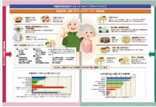
高齢者等地域見守りネットワーク・サポートサービス http://f-mimamori.net/