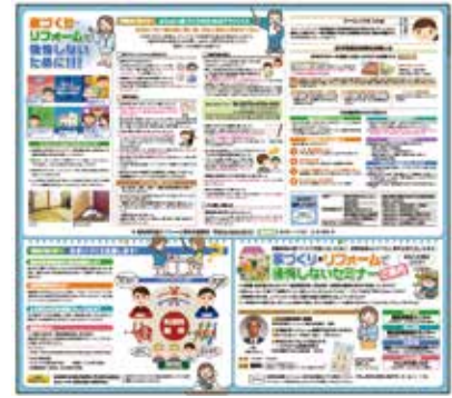
地域協議会新聞広告「後悔しない家づくり・リフォームのすすめ」