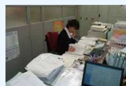
地域協議会相談受付状況