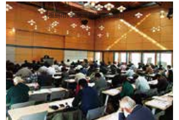
住宅省エネルギー設計者講習会 (郡山市「福島県農業総合センター」)