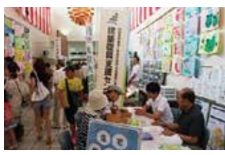
ふくしまみんなの住宅フェア会津