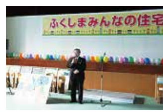
ふくしまみんなの住宅フェアいわき