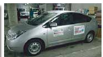
公用車用マグネットシート