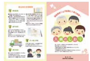
福島県借り上げ住宅に入居の皆様へ 入居のしおり