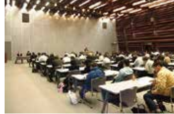
建築士定期講習会 (郡山市「ビッグパレット福島」)