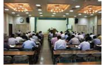
管理建築士講習会 (福島市「福島県建設センター」)