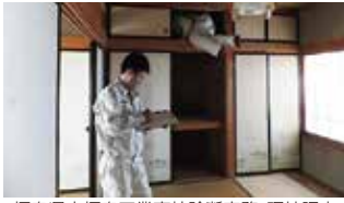
福島県立福島工業高校診断実務・現地調査