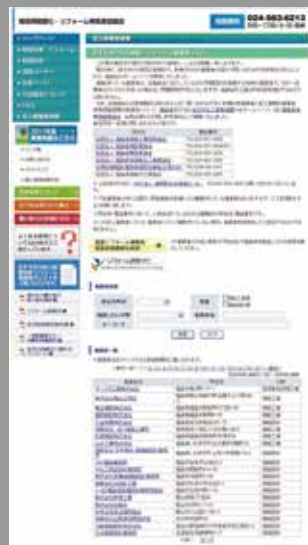
安心事業者登録データベース (2013年1月現在692件)

地域協議会HPに「団体推薦優良事業者の登録・更新・公開とリフォームに関する情報提供」を行いました。