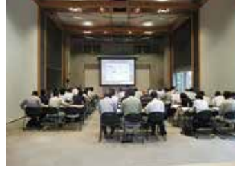
福島県木造住宅耐震診断業務講習会 (会津若松市「ハイテクプラザ会津若松技術支援センター」)