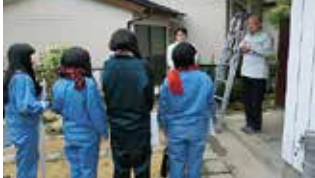
福島県立郡山北工業高校診断実務・現地調査