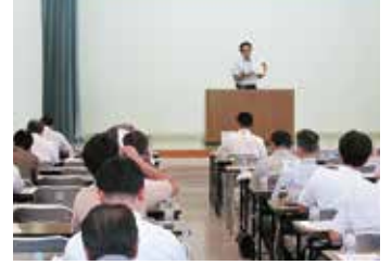
住まいるネットワーク福島説明会 (福島市「福島県青少年会館」)