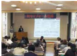
住宅リフォーム講座 (福島市「福島県青少年会館」)