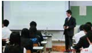
福島県立会津工業高校授業風景