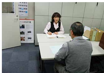
地域協議会相談対応状況