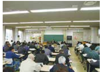
住宅省エネルギー施工技術講習会 (いわき市「いわき建設会館」)