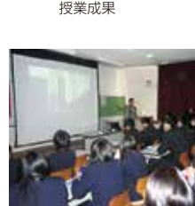
福島県立福島工業高校授業