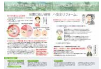
耐震リフォームガイド