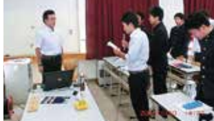
福島県立会津工業高校授業風景