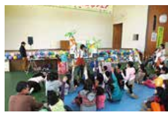
ふくしまみんなの住宅フェア福島