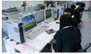
福島県立郡山北工業高校診断実務