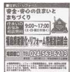
復興住宅・リフォームフェア新聞広告