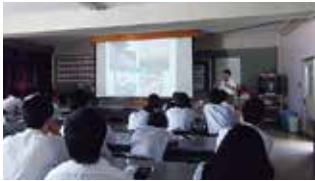
福島県立郡山北工業高校授業風景