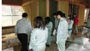
福島県立会津工業高校診断実務・現地調査