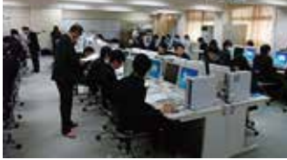
福島県立福島工業高校診断実務