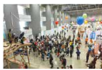
ふくしまみんなの住宅フェア郡山