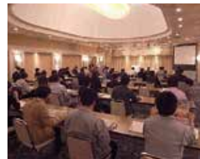
住宅リフォーム相談会窓口担当者講習会 (福島市「ホテルグリーンパレス」)